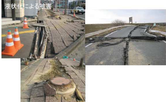
第6回セミナー オフィス・ビル内で起る地震被害を想定する(状況付与資料) 2012.11.29 10