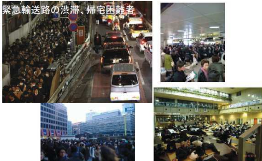
第6回セミナー オフィス・ビル内で起る地震被害を想定する(状況付与資料) 2012.11.29 9