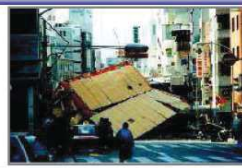
第6回セミナー オフィス・ビル内で起る地震被害を想定する(状況付与資料) 2012.11.29 14