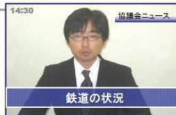
第6回セミナー オフィス・ビル内で起る地震被害を想定する(状況付与資料) 2012.11.29 15