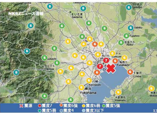
第6回セミナー オフィス・ビル内で起る地震被害を想定する(状況付与資料) 2012.11.29 13