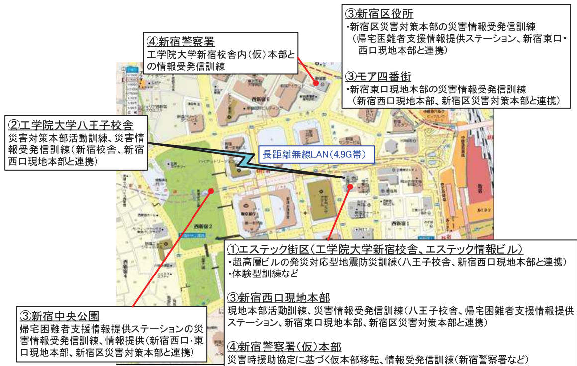
図 1-2 平成 21 年度地震防災訓練の全体概要

6 階、5 階、4 階、1 階、B1 階、エステック広場：防災講演、展示見学、体験型訓練 2 階 Jobstaion 前：被害の全体像把握、対応方針の決定など