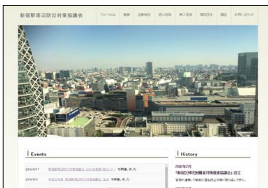
新宿駅周辺防災対策協議会Webサイト

( http://kouzou.cc.kogakuin.ac.jp/ssa_bousai/index.html )