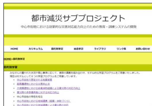
学習プログラムの公開Webサイト

( http://kouzou.cc.kogakuin.ac.jp/ssa_bousai/index.html )