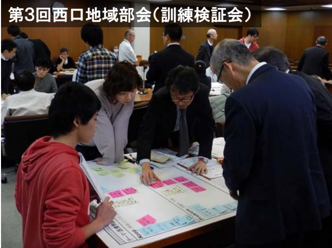
第3回西口地域部会(訓練検証会)