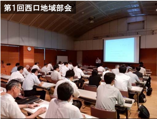
第1回西口地域部会