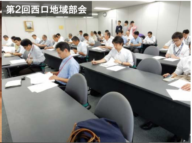
第2回西口地域部会