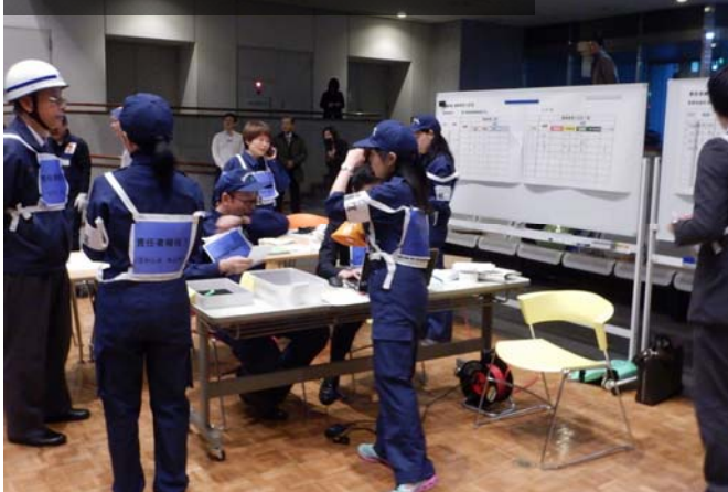
トリアージポスト／事務エリア