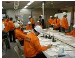
写真1 災害対策本部