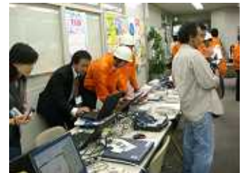
写真2 災害対策本部