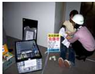
写真3 防災対応の様子