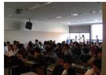
写真4 避難階の様子