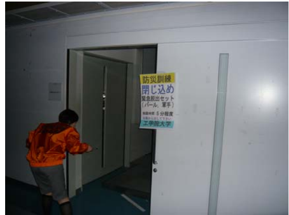
写真3 閉じ込めへの対応の様子 (2008年10月22日防災訓練)