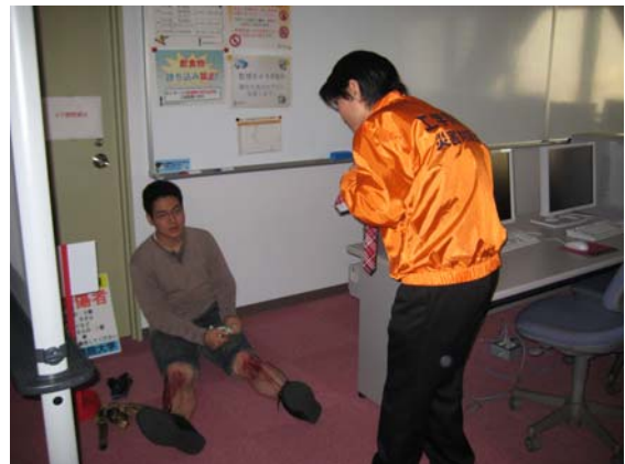
写真1 傷病者への対応の様子 (2008年10月22日防災訓練)