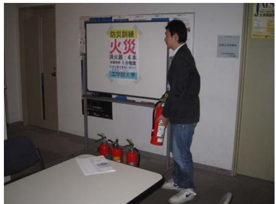
写真2 火災への対応の様子 (2008年10月22日防災訓練)